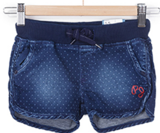
SZORTY GIZEL PEPE JEANS LONDON

Modę na połączenie denim+denim zapoczątkowała Rihanna. Mała North chyba polubiła ten trend. W takim zestawie prezentuje się niezwykle stylowo.