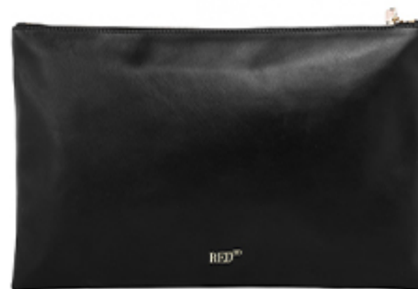
KOPERTÓWKA RED VALENTINO