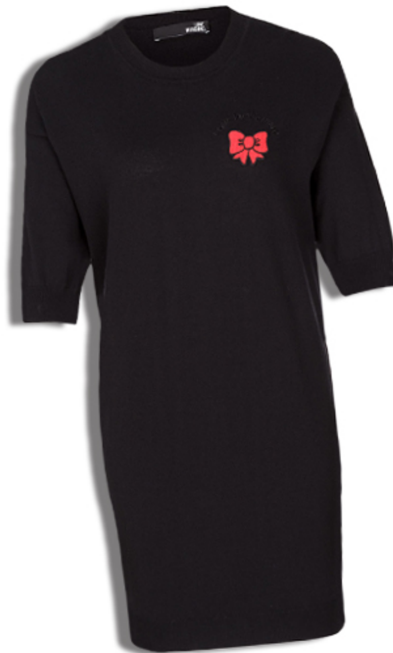
SUKIENKA LOVE MOSCHINO