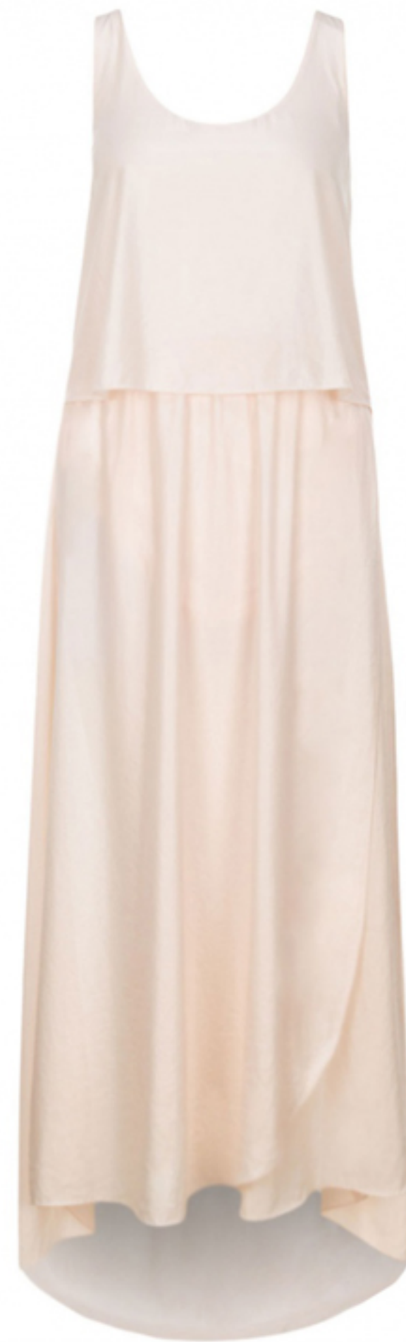
SUKIENKA GLAMY BOSS ORANGE