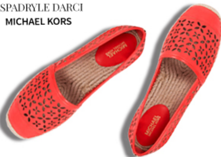
ESPADRYLE DARCI MICHAEL KORS