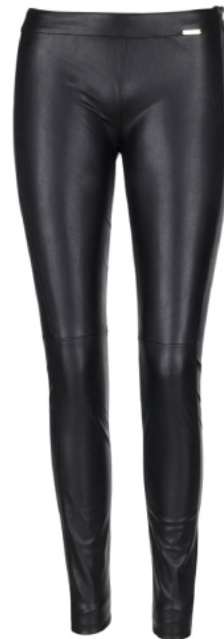
LEGGINSY SONIA GUESS JEANS