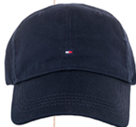
BEJSBOLÓWKA TOMMY HILFIGER