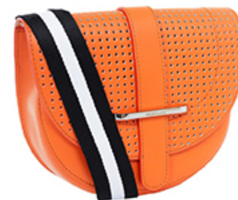
LISTONOSZKA OTTICHE MAXMARA WEEKEND