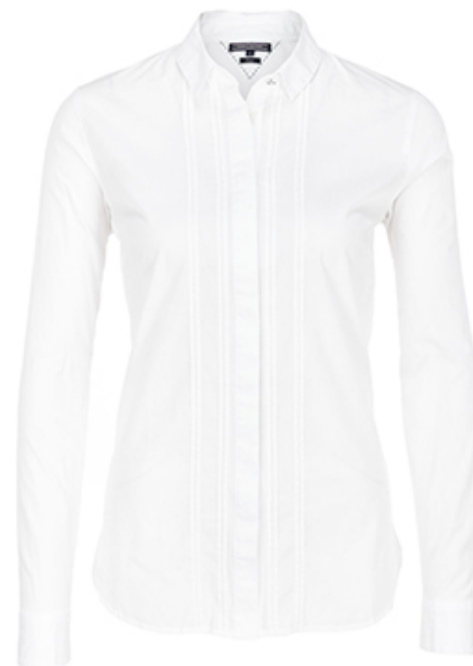
KOSZULA DAMARIS TOMMY HILFIGER

W zestawieniu z klapkami zawsze sprawdzi się klasyczny zestaw: trochę za krótkie i niezbyt obcisłe jeansy, biała koszula albo t-shirt i elegancka shopperka.