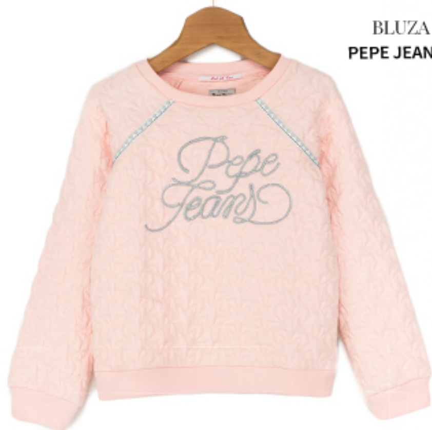
BLUZA SYLVIE PEPE JEANS LONDON