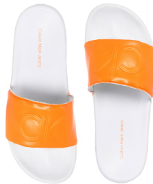
KLAPKI CHARLOTTE MATTE SMOOTH CALVIN KLEIN JEANS

Kolorowe klapki prezentują się doskonale w połączeniu z czarnymi spodniami i kolorowymi dodatkami.