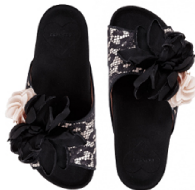
KLAPKI PIZZO TWIN-SET

Klapki możesz też nosić do eleganckich outfitów. Wybieraj wówczas fasony delikatne, na przykład te zdobione koralikami czy modele w kolorze złota i srebra.