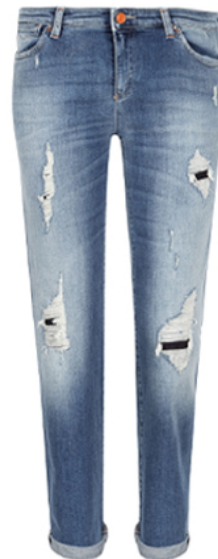
BOYFRIENDY J15 DAISY ARMANI JEANS