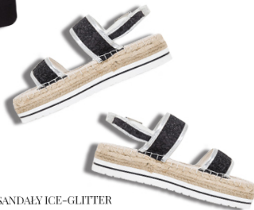
SANDALY ICE-GLITTER LOVE MOSCHINO