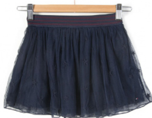
SPÓDNICA STAR TOMMY HILFIGER