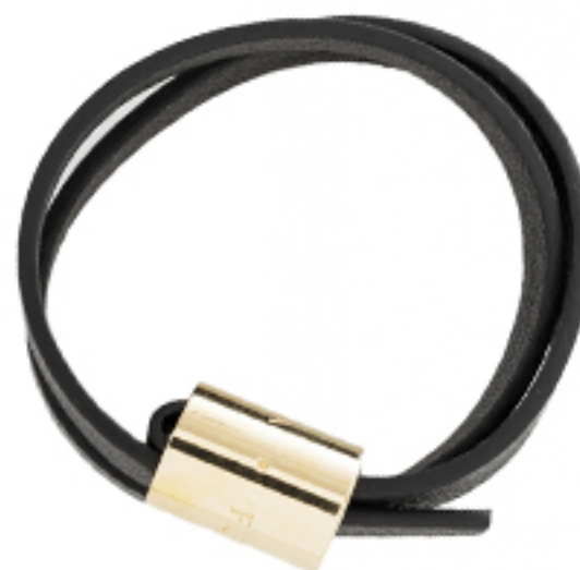
BRANSOLETKA LACE FURLA