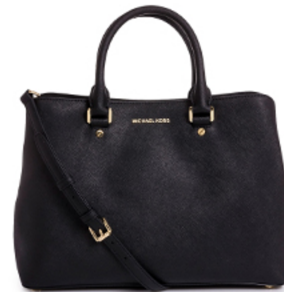
KUFEREK SAVANNAH MICHAEL KORS