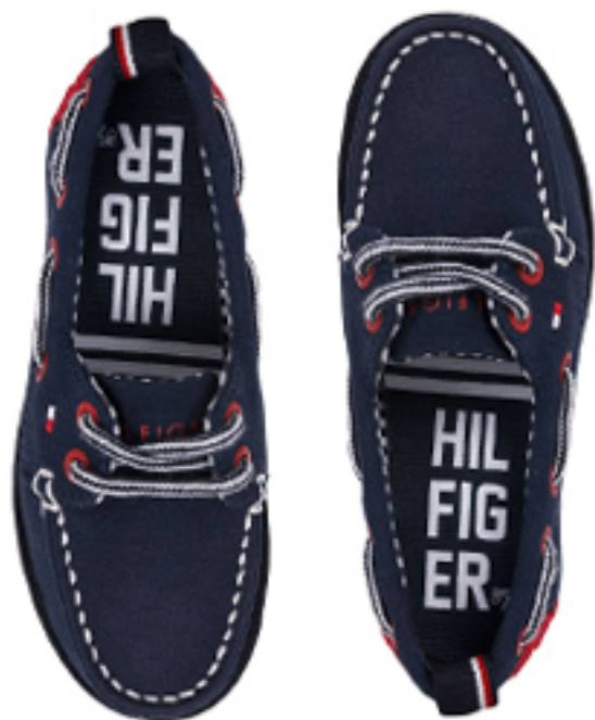
MOKASYNY DECK JR 1D-1 TOMMY HILFIGER