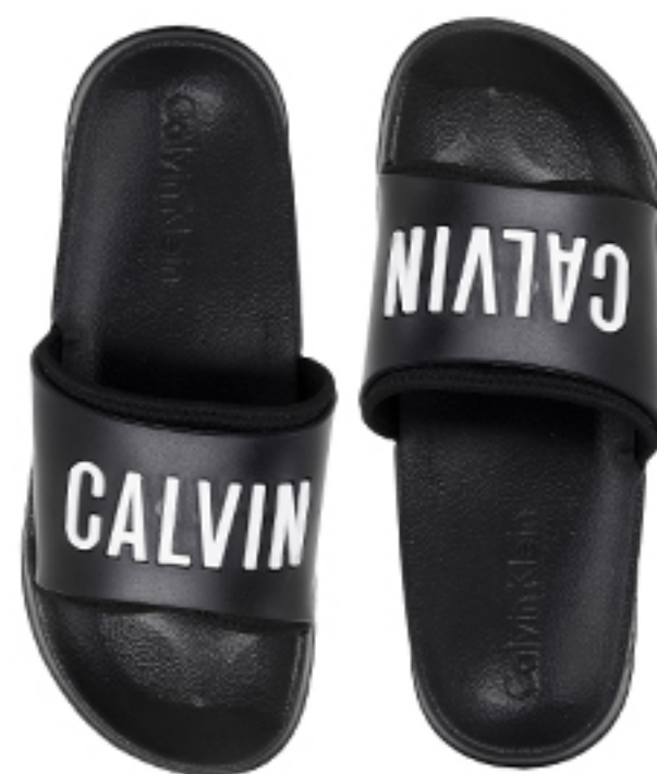
KLAPKI CALVIN KLEIN UNDERWEAR