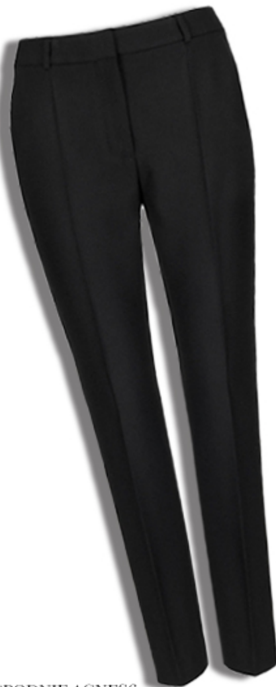
SPODNIE ACNES6 BOSS