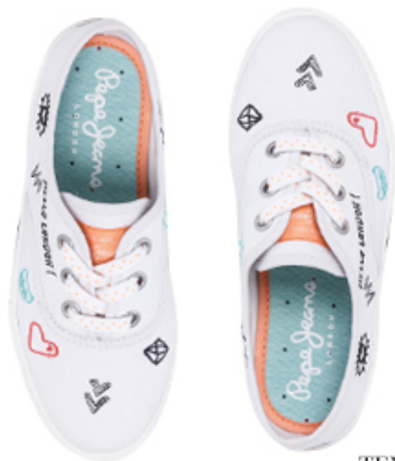
TENISÓWKI SOHO DRAW PEPE JEANS LONDON

Wersja sweet baby czyli połączenie bladego różu i bieli. Uroczo, ale z klasą!