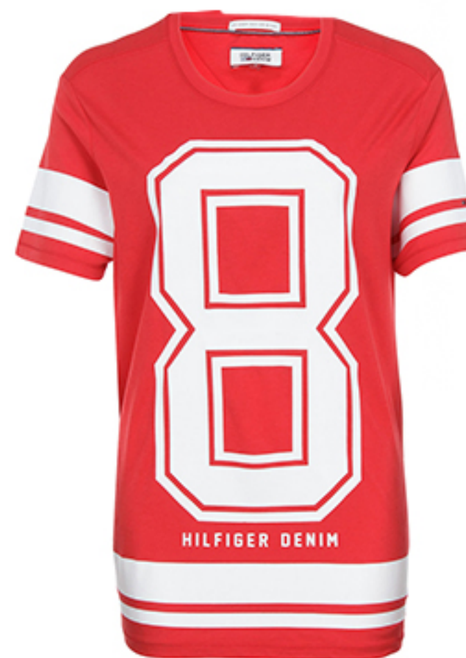
T-SHIRT FINE HILFIGER DENIM