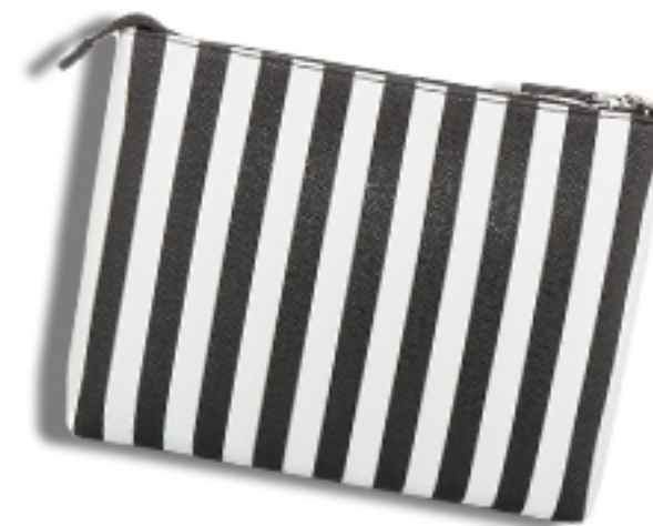
KOPERTÓWKA STRIPES LIU JO