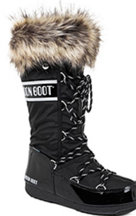
5. MOON BOOT

Mają rzesze zwolenniczek wśród kobiet, chociaż mężczyźni nie pałają do nich miłością. Można im zarzucić wiele, ale nie można odmówić tego, że są superciepłe i bardzo wygodne. Uratują Cię podczas wypadu w góry, spaceru w zimowy wieczór i w każdy mroźny poranek. Są grube, wręcz puchate, raczej niezgrabne, może trochę pokraczne. Brzmi mało modnie? A jednak lansują je fashionistki na całym świecie!