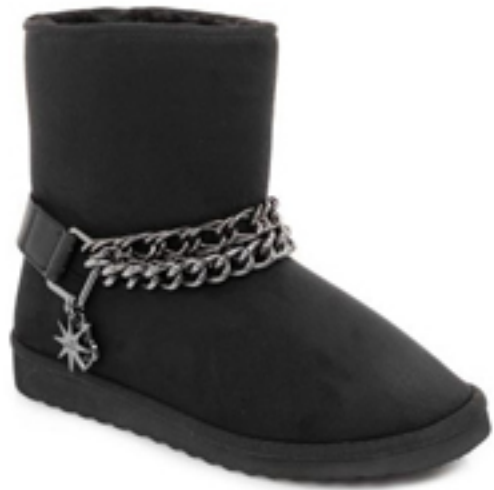
2. MICHAEL KORS