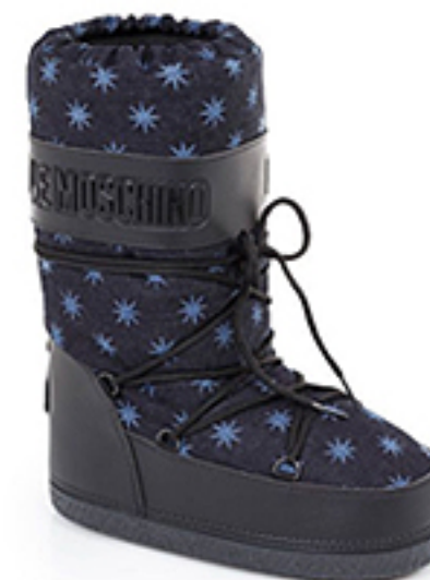
6. LOVE MOSCHINO