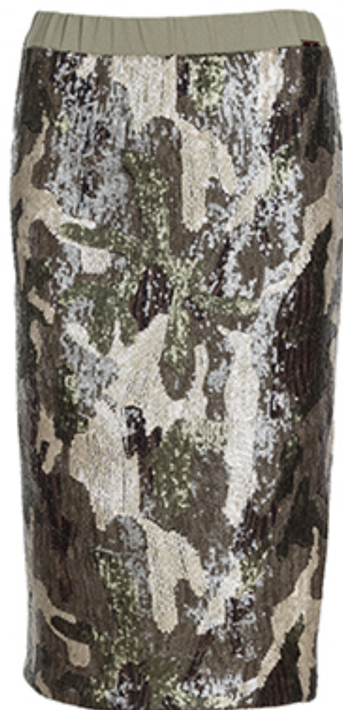
SPÓDNICA LIU JO JEANS