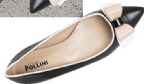
LISTONOSZKA KARL LAGERFELD