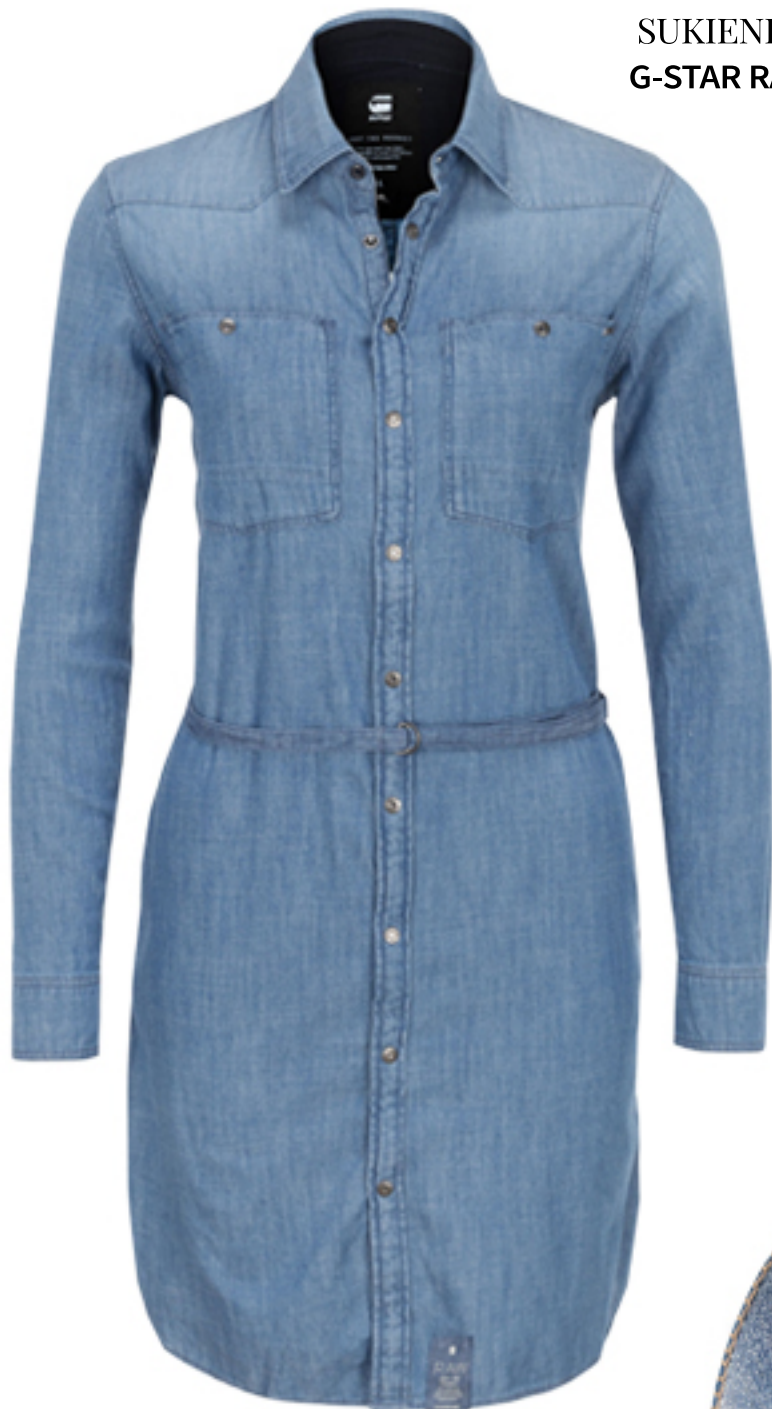
SUKIENKA G-STAR RAW

Sukienka zapinana na całej długości na napy i buty w jeansowym kolorze to propozycja dla amatek minimalizmu i guzikowych fetyszystek:) Pamiętaj, podwiń rękawy by wyeksponować skórzaną bransoletkę i klasyczny zegarek!