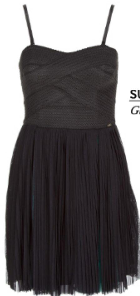
SUKIENKA Guess Jeans