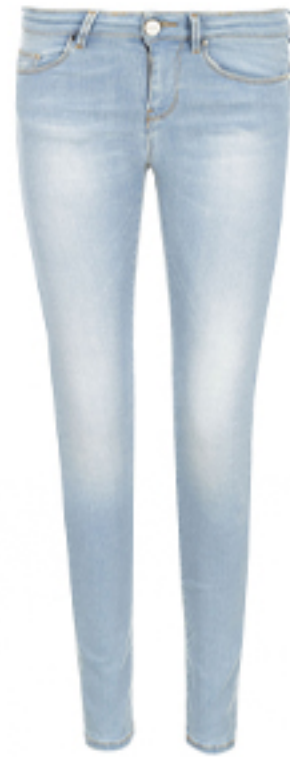
JEANSY FUJICO PINKO