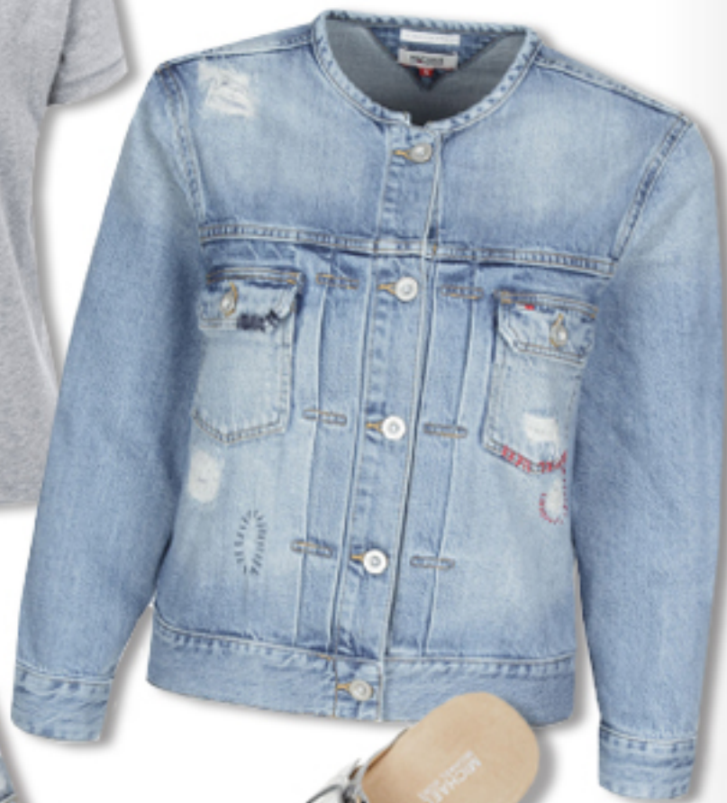
KURTKA HILFIGER DENIM