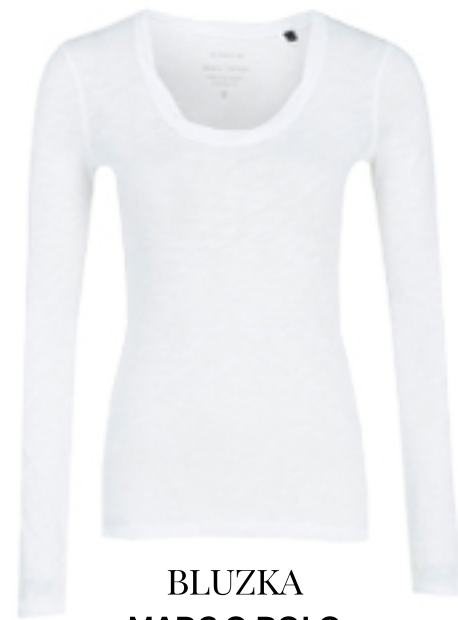
BLUZKA MARC O POLO