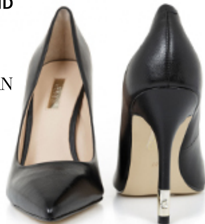
SZPILKI BAYAN GUESS