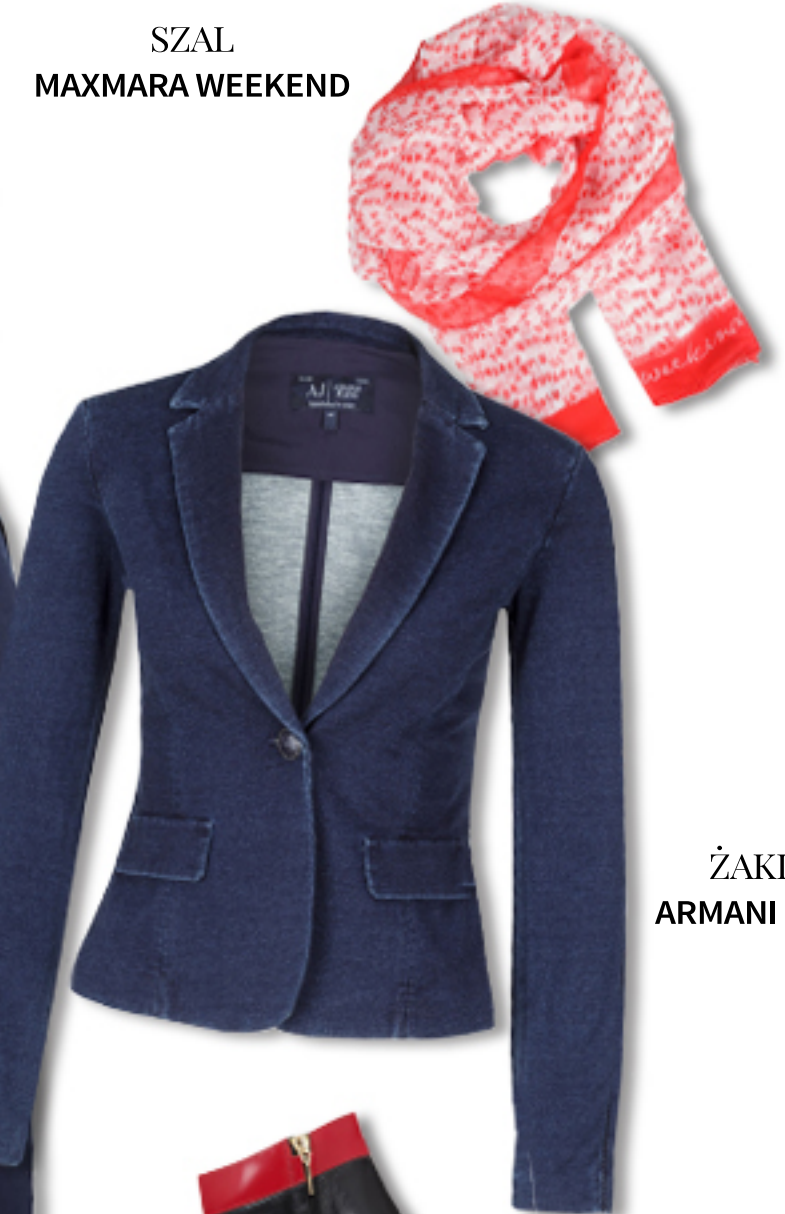
SZAL MAXMARA WEEKEND