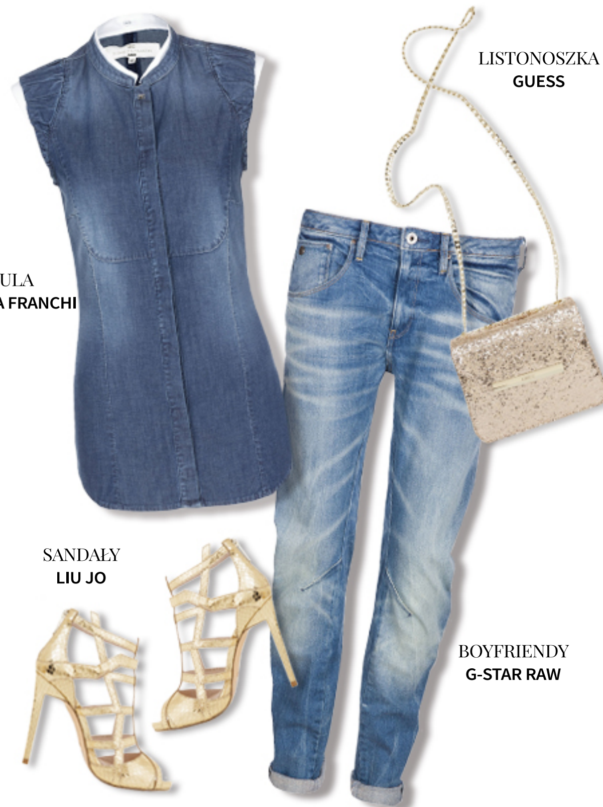
BOYFRIENDY G-STAR RAW