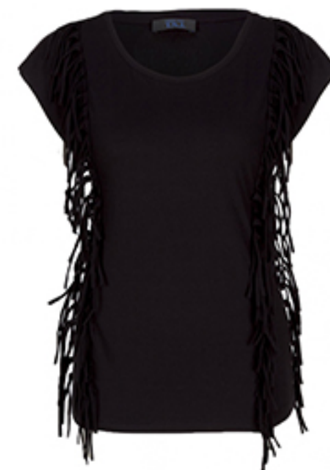
BLUZKA Twin-Set Jeans

Jeśli spódnica w kształcie litery „A” wyda Ci się za mało seksowna, weź przykład z Nicole Richie. Trik z rozcięciem sprawdzi się na każdej długości – teraz z powodzeniem możesz nosić także długości midi i maxi, nawet wówczas, gdy, podobnie jak Nicole, masz zaledwie 155 cm wzrostu.