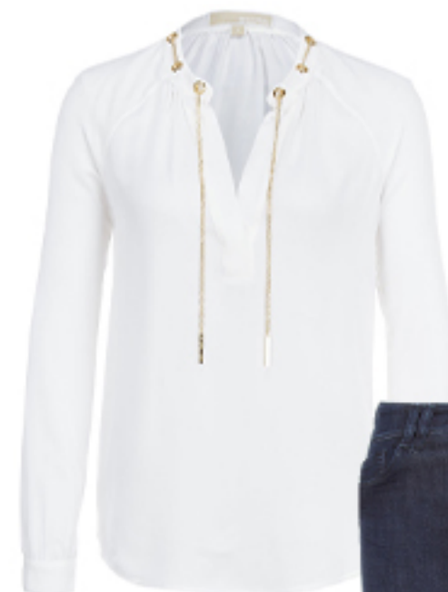
BLUZKA Michael Kors

Głęboki dekolt wydłuża tułów, ale uwaga – tylko ten w literę „V”. Zaprzyjajnij się z nim tak, jak to zrobiła Mila Kunis – aktorka ma tylko 163 cm wzrostu, ale chyba wszyscy dali się nabrać, że mierzy więcej niż 170!