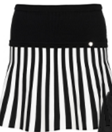
SPÓDNICA Liu Jo