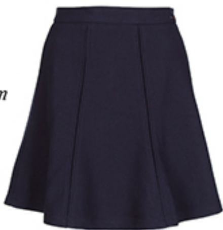
SPÓDNICA Hilfiger Denim