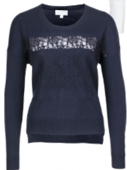
SWETER Escada Sport