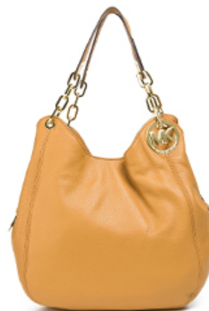
HOBO FULTON Michael Kors