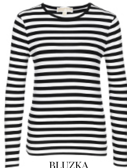
BLUZKA MICHAEL KORS