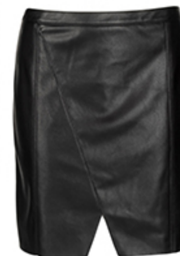
SPÓDNICA Boss Orange