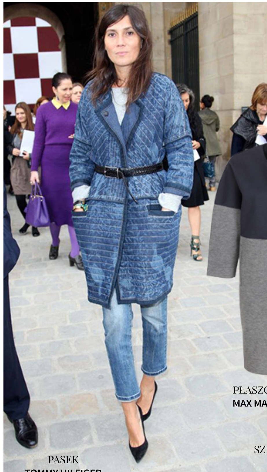
PASEK TOMMY HILFIGER