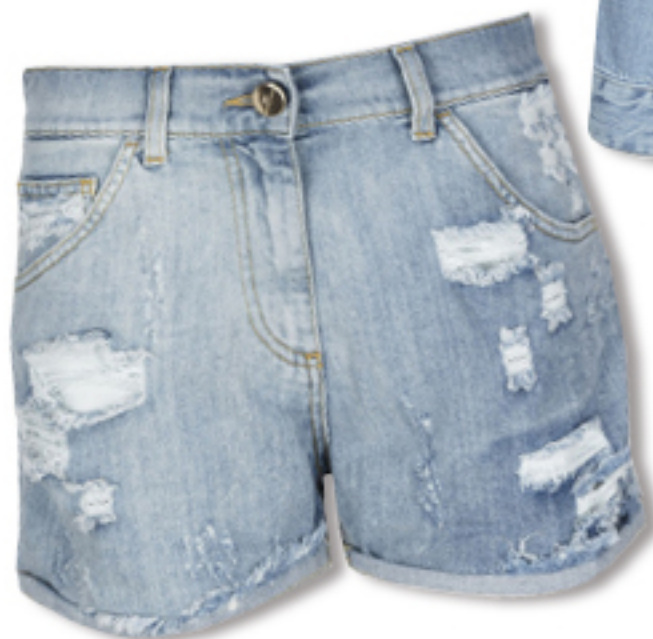
SZORTY ELISABETTA FRANCHI