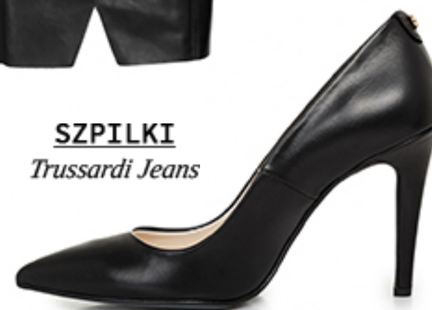
SZPILKI Trussardi Jeans