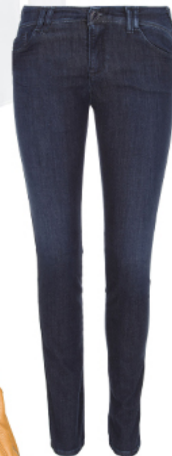
JEANSY Armani Jeans