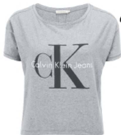
T-SHIRT Calvin Klein Jeans

Idealne rozwiązanie, gdy pragniesz wysmuklić talię i wydłużyć nogi. Dodatkowo spodnie z wysokim stanem tuszują niedoskonałości, spłaszczają brzuch i... są super modne w tym sezonie! Ten zabieg stosuje m.in. Karrueche Tran. Uwierzyć, że ma jedynie 155 cm wzrostu?