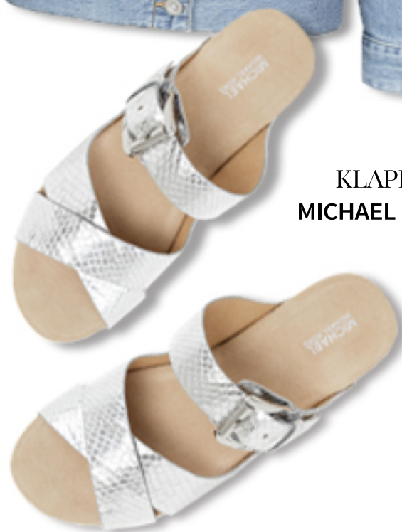
KLAPKI MICHAEL KORS