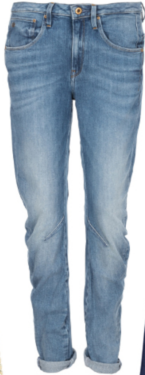
BOYFRIENDLY G-STAR RAW