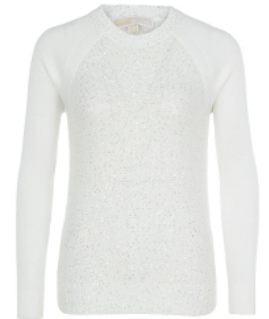
SWETER MICHAEL KORS