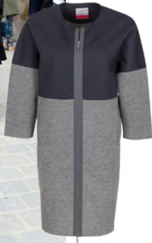
PLASZCZ GUSTAVO MAX MARA WEEKEND