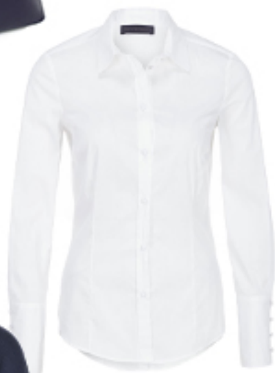
KOSZULA Tru Trussardi