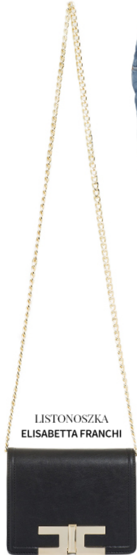
LISTONOSZKA ELISABETTA FRANCHI