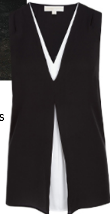
BLUZKA MICHAEL KORS