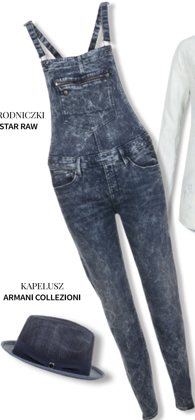
KAPELUSZ ARMANI COLLEZIONI