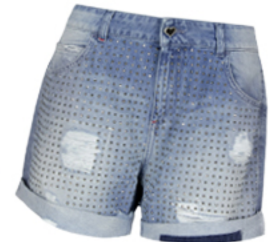
SZORTY TWIN-SET JEANS