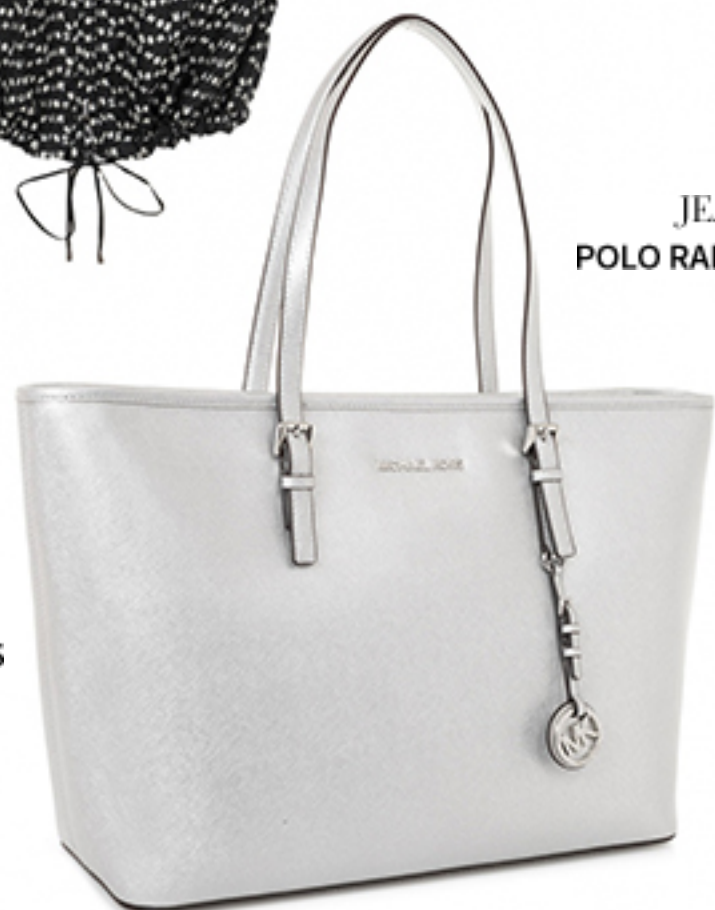
SHOPPERKA MICHAEL KORS