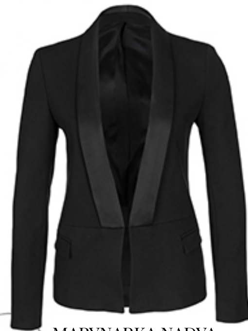
MARYNARKA NADYA KARL LAGERFELD