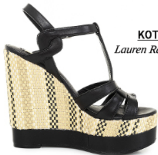
KOTURNY Lauren Ralph Lauren