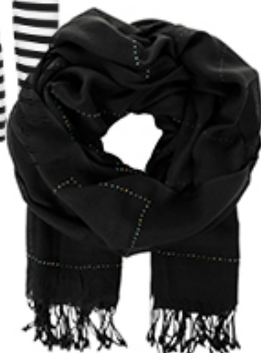
SZAL Liu Jo