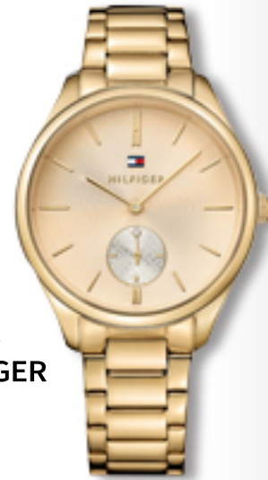
ZEGAREK TOMMY HILFIGER