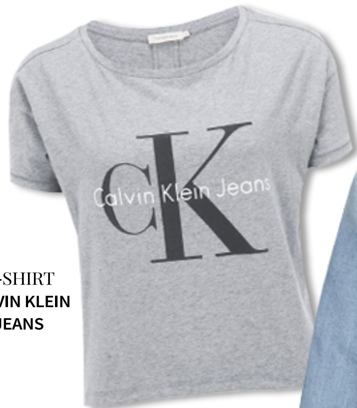
T-SHIRT CALVIN KLEIN JEANS

Stało się. Klapki zyskały podwójne miano „naj”: najwygodniejsze i... najmodniejsze. Zestaw je z jeansowym outfitem. Taka stylizacja wywinduje Cię na modowe wyżyny!