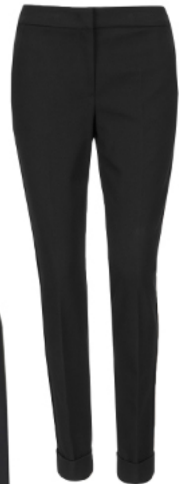
SPODNIE ARMANI COLLEZIONI