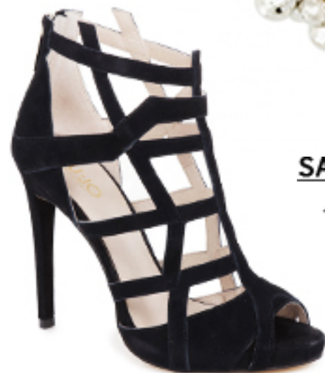
SANDAŁY Liu Jo