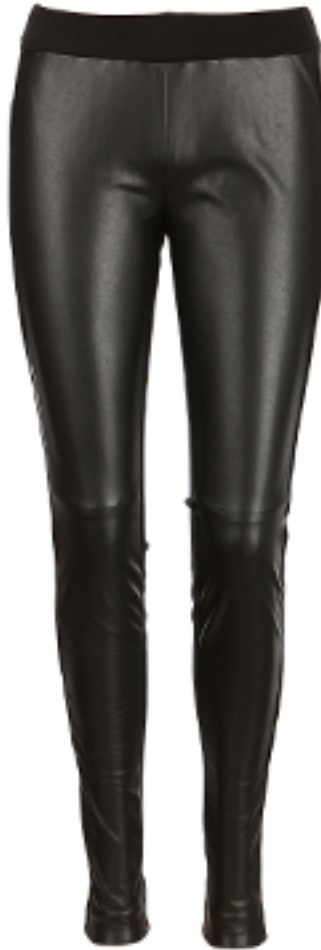
LEGGINSY HEMJA HUGO