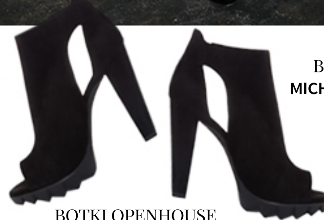
BOTKI OPENHOUSE STUART WEITZMAN