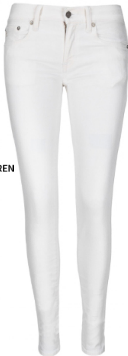
JEANSY POLO RALPH LAUREN