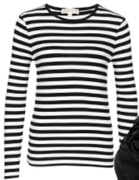
BLUZKA Michael Kors