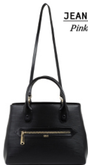
SHOPPERKA Armani Collezioni