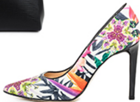
SZPILKI Studio Pollini