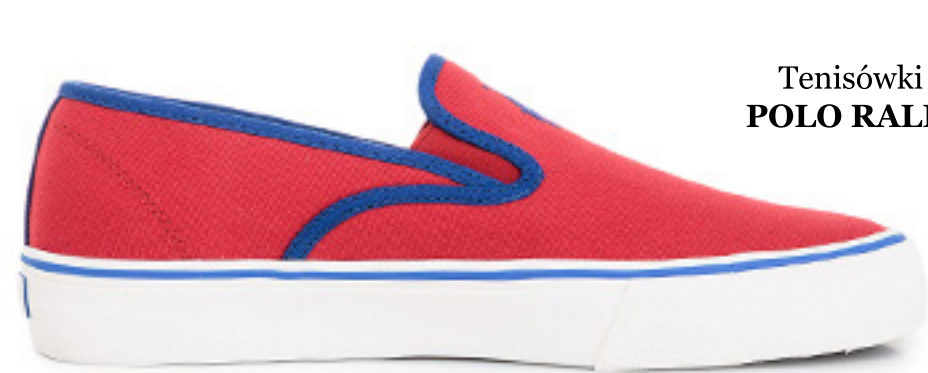
Slip On Mytton-ne POLO RALPH LAUREN