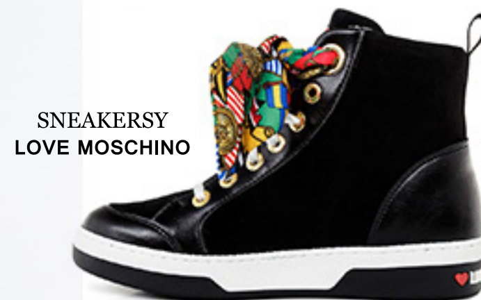
SNEAKERSY LOVE MOSCHINO