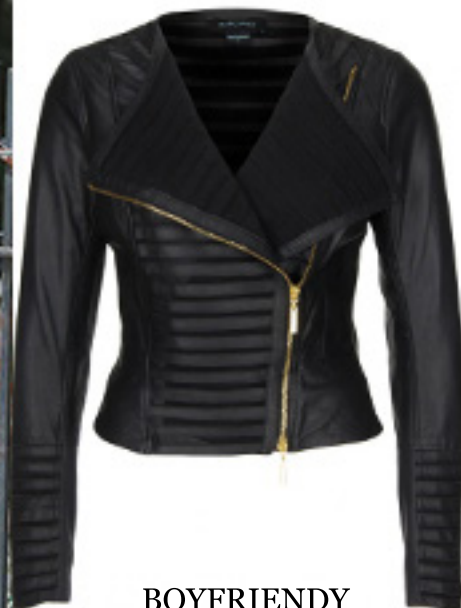
BOYFRIENDY ESCADA SPORT