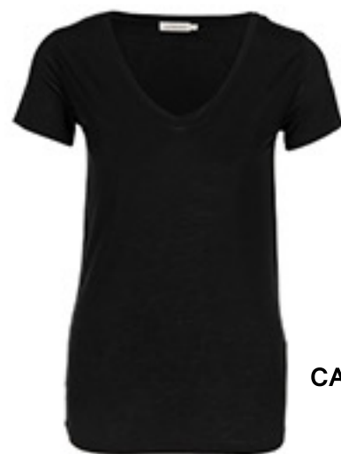
T-SHIRT CALVIN KLEIN JEANS