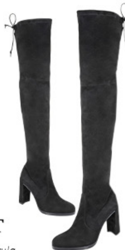
KOZAKI STUART WEITZMAN

Obciste, czarne jeansy, t-shirt v-neck, kraciasta koszula zawiązana na biodrach. Bardzo w stylu grunge, ale... charakter całości zmieniają zamszowe kozaki na obcasie po dołowy uda! Ciekawe przemycenie aktualnych trendów i bardzo nowatorskie podejście do tej „wiekowej” kurtki!