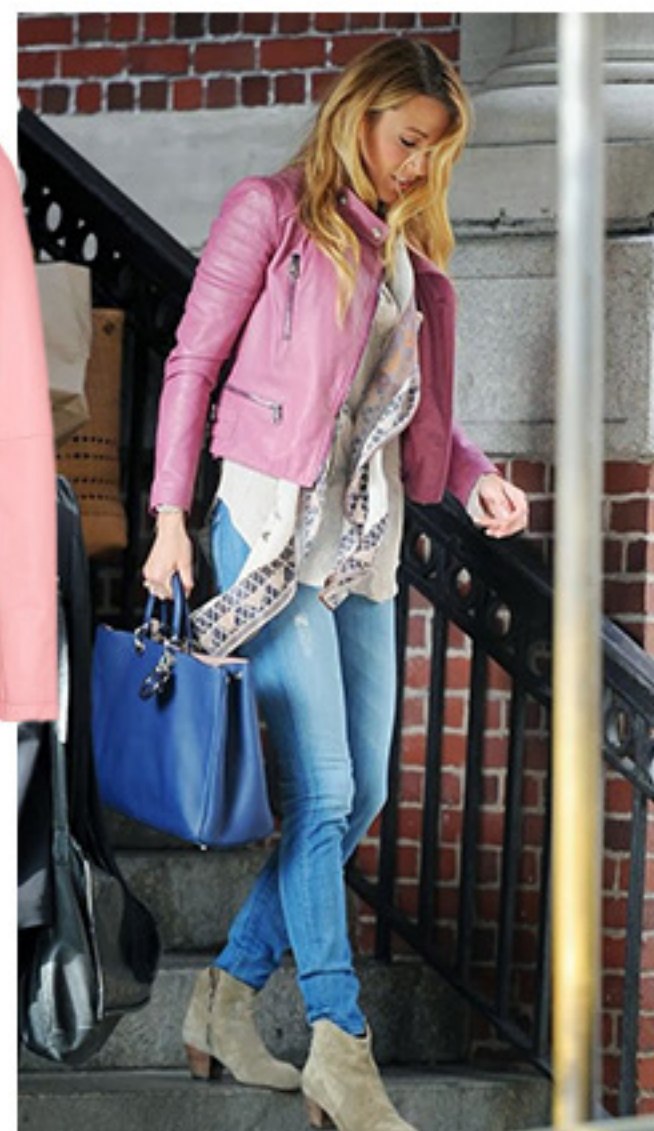
PINK NOT DEAD