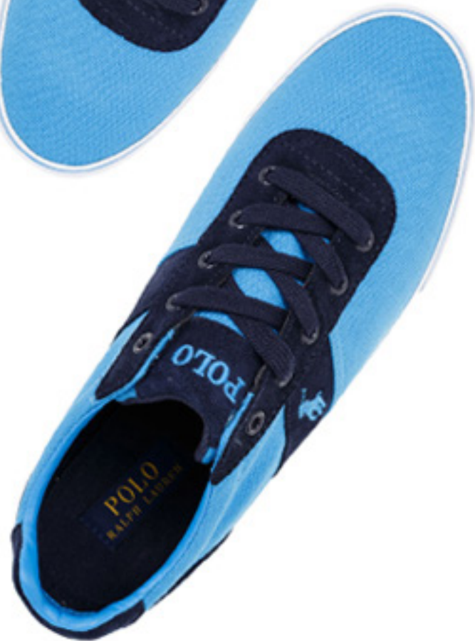
Sneakersy Ponteland POLO RALPH LAUREN