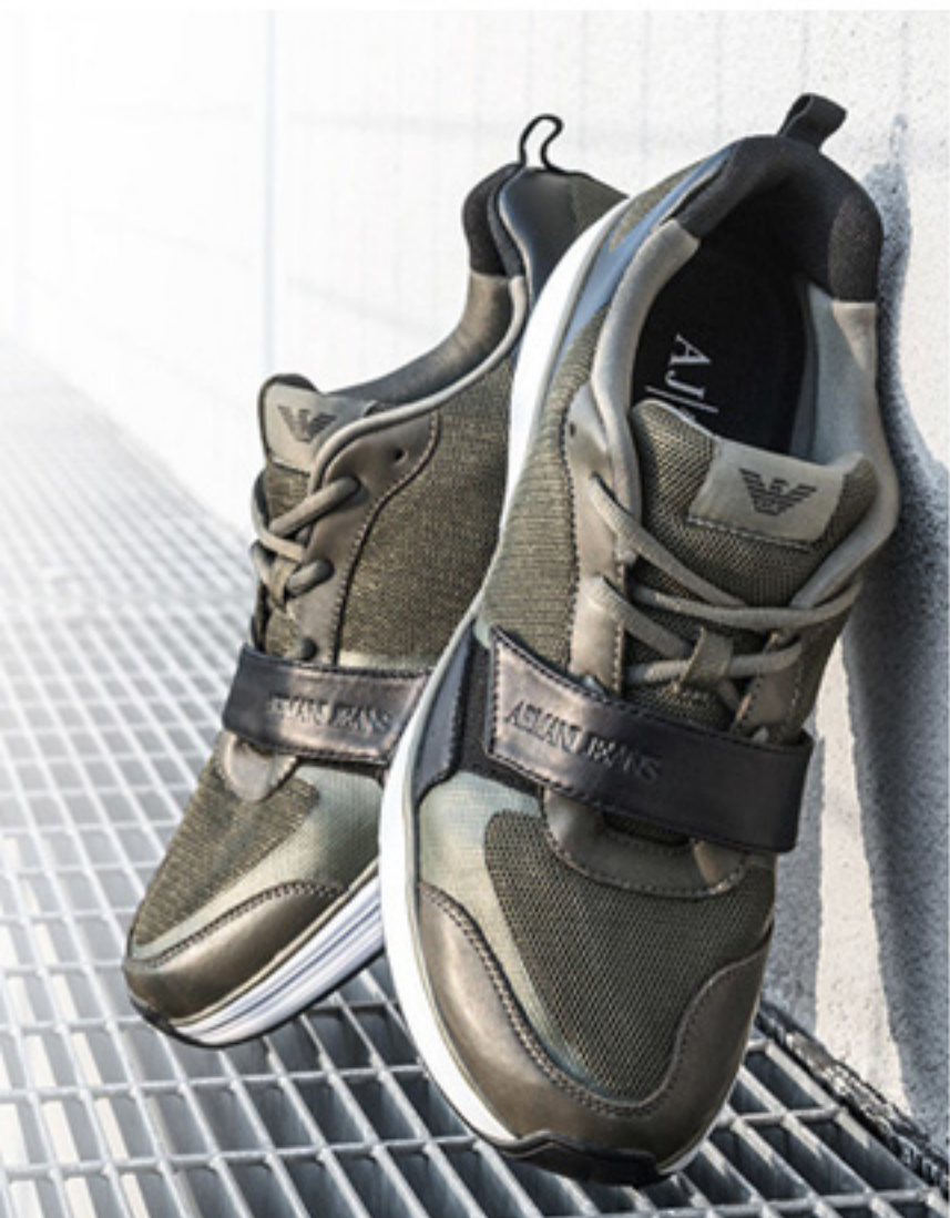
Sneakersy ARMANI COLLEZIONI