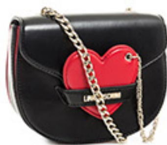
LISTONOSZKA LOVE MOSCHINO