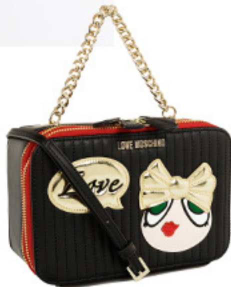
SATCHEL LOVE MOSCHINO