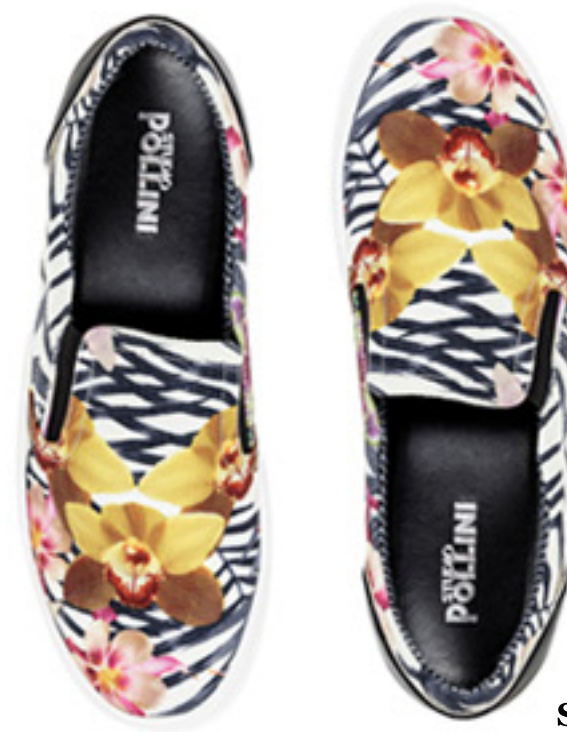
Slip On STUDIO POLLINI