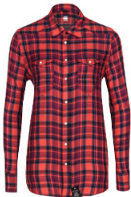
KOSZULA TACOMA G-STAR RAW