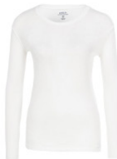
BLUZKA POLO RALPH LAUREN