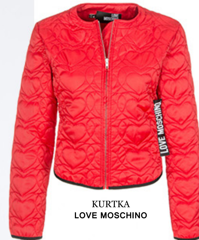
KURTKA LOVE MOSCHINO