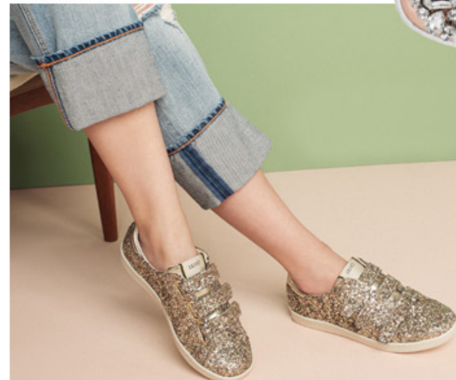
Sneakersy Brunico MAX MARA WEEKEND