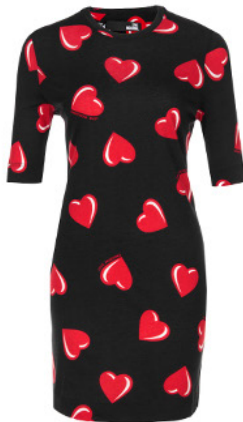
SUKIENKA LOVE MOSCHINO