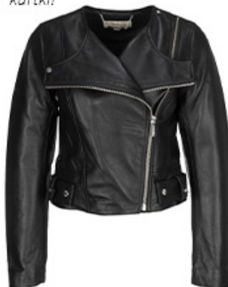
KURTKA MICHAEL KORS