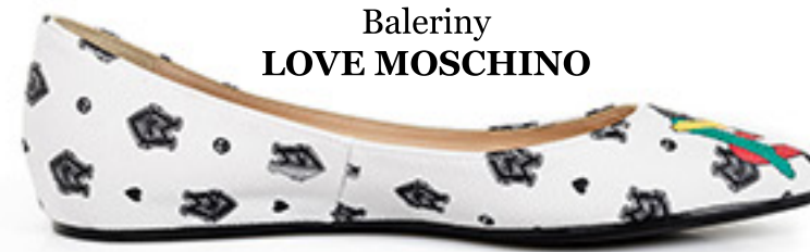
Baleriny LOVE MOSCHINO