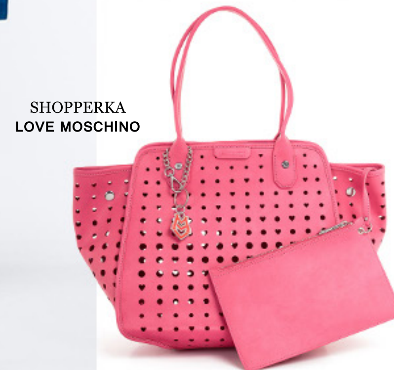
SHOPPERKA LOVE MOSCHINO