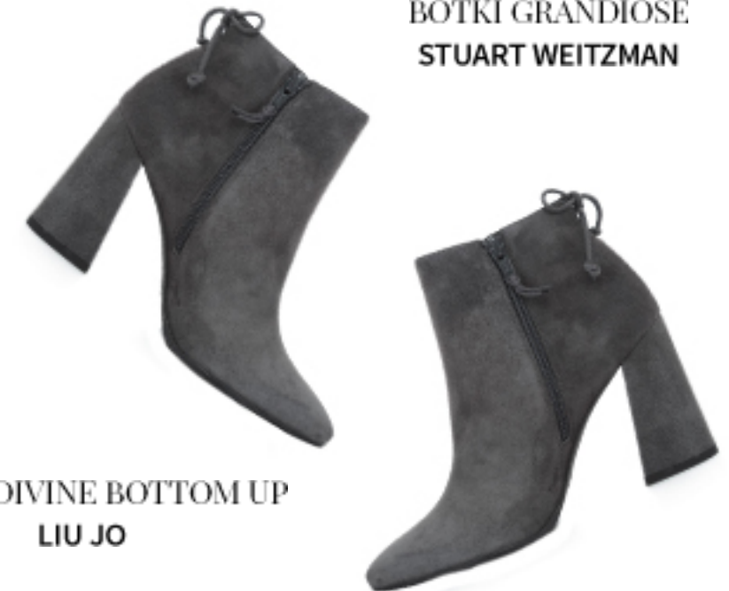
BOTKI GRANDIOSE STUART WEITZMAN