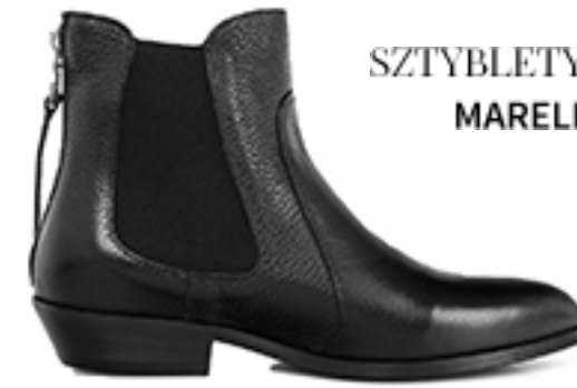
SZTYBLETY LIVIO MARELLA