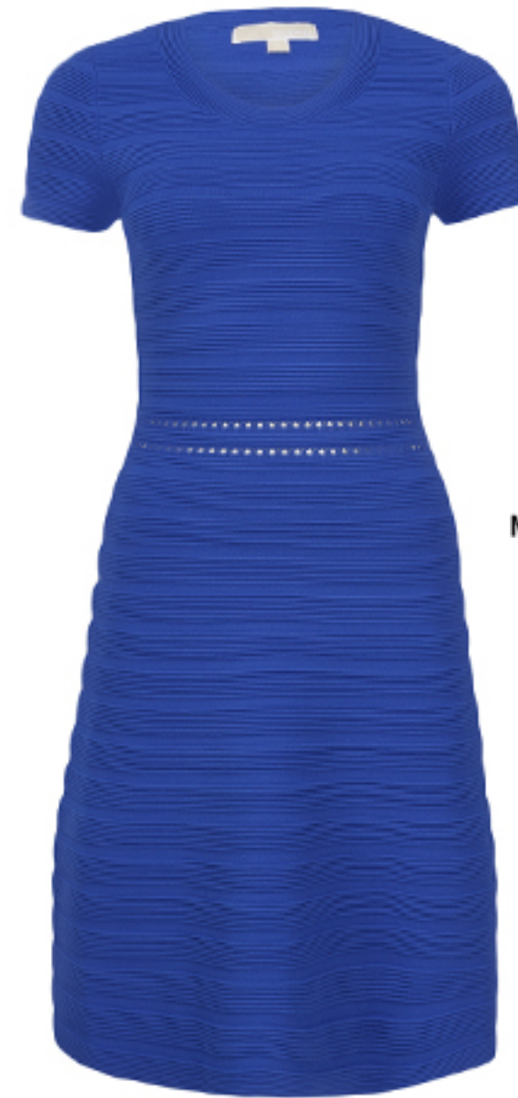
SUKIENKA MICHAEL KORS