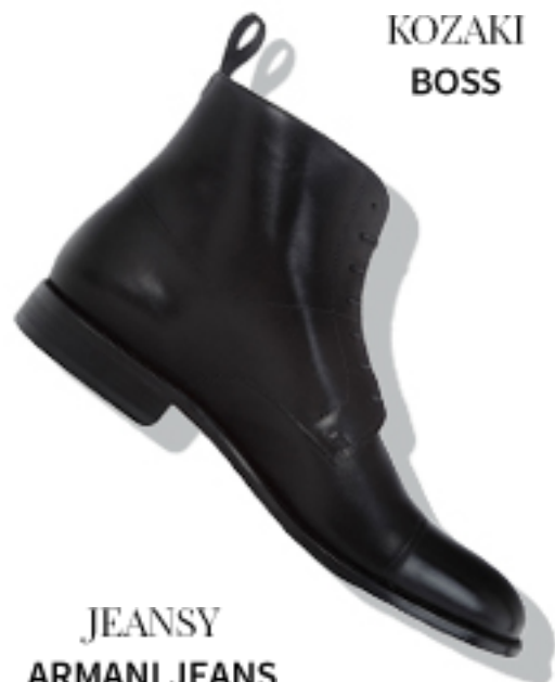
JEANSY ARMANI JEANS