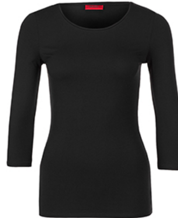
BLUZKA DANINA HUGO