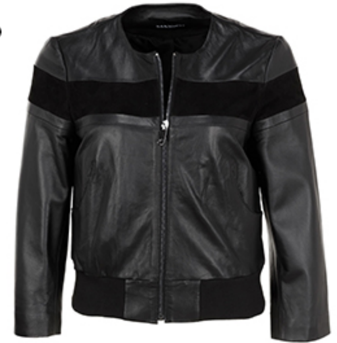
KURTKA DALLAS MAX&CO.