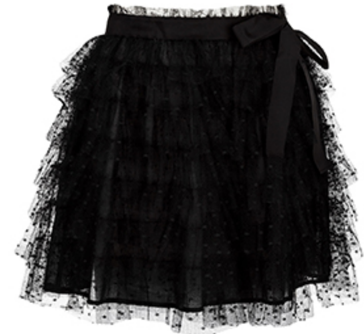
SPÓDNICA RED VALENTINO