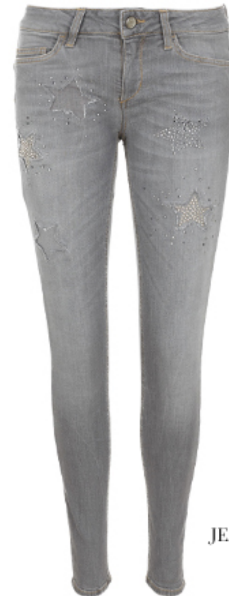
JEANSY DIVINE BOTTOM UP LIU JO