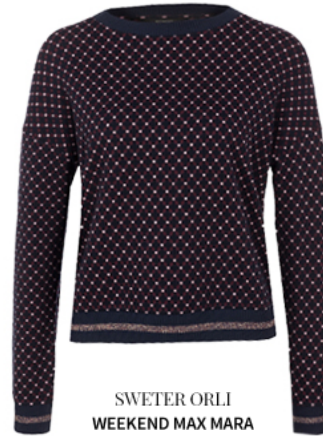
SWETER ORLI WEEKEND MAX MARA